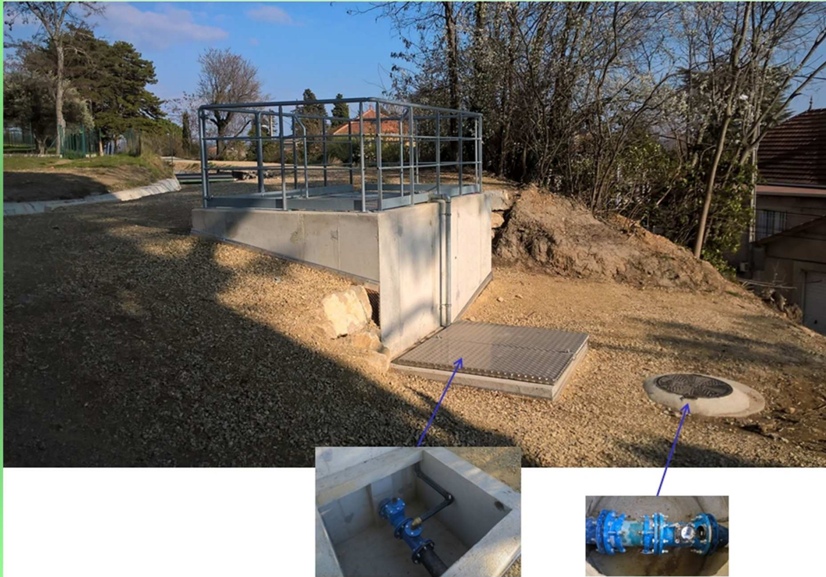
Ouvrage de prise sur le canal maître avec dispositif de comptage général