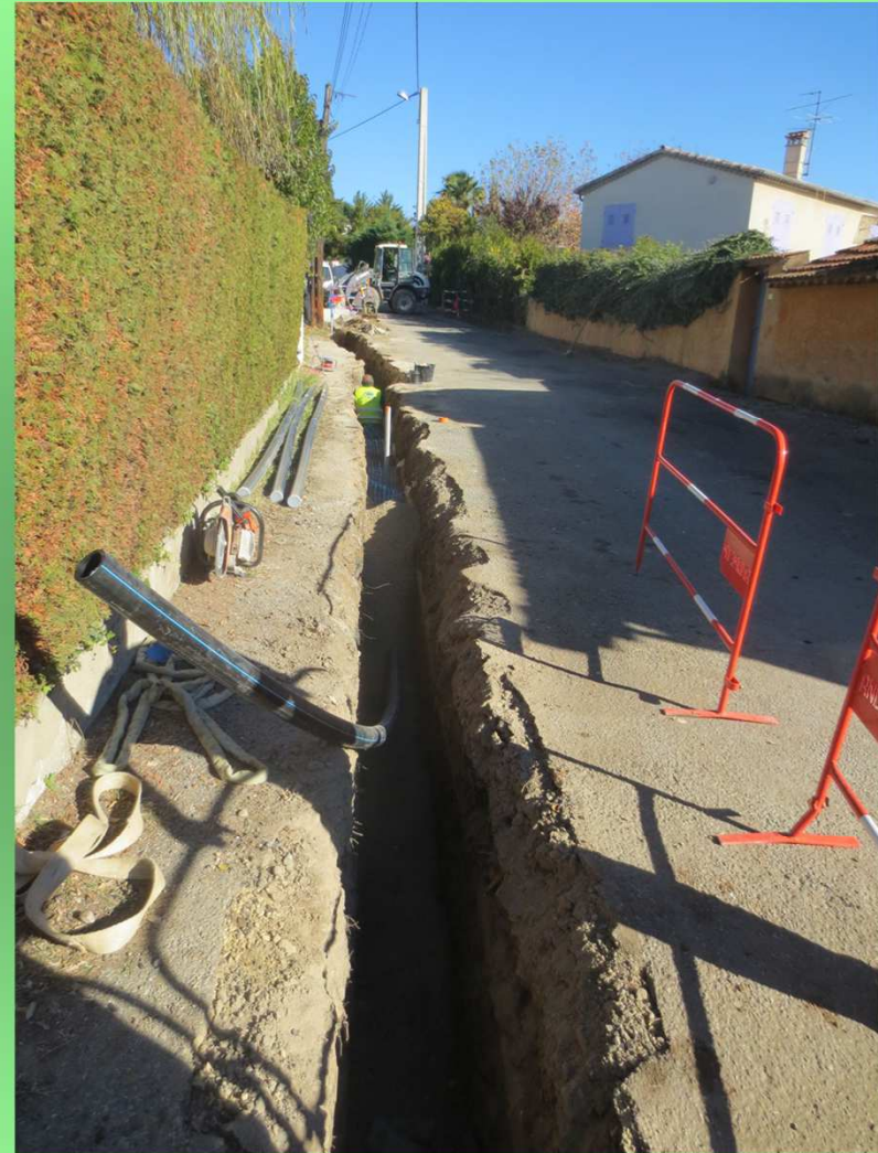
Pose de conduites en tranchée sous voiries (chemin du Prêche)