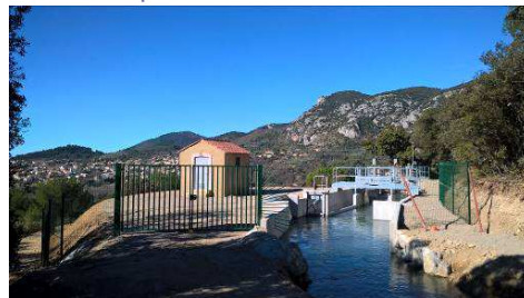
Vanne régulée et son édifice (entreprises BUCCI, ACTEMIUM, GARNIER, MONNET)

Des travaux connexes de cuvelage du canal maître en amont de cette vanne ont été rendus nécessaires sur environ 1 100 mètres. Pour tenir compte de la durée restreinte du chômage hivernal du canal, ils sont réalisés en deux phases : hiver 2018/2019, qui est achevée, et hiver 2019/2020.