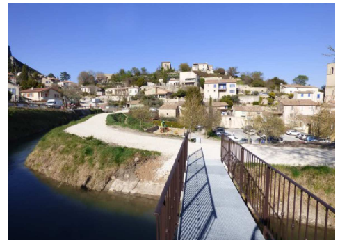
Vue d'ensemble de la promenade aménagée depuis la passerelle

Il est précisé que les autres tronçons du canal maître, en l'absence de conventions de superposition d'affectations signées avec les collectivités concernées, sont toujours interdits d'accès au public.