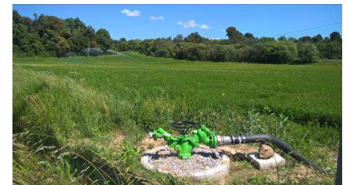
Irrigation à partir d'une borne installée (entreprise PAC)

A ce jour, les travaux du secteur de la plaine du Largue sont terminés.