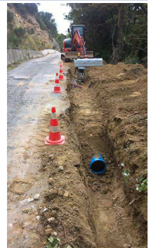
Pose de conduites (entreprises PAC, BUCCI)

Le secteur de La Ricaude à Villeneuve disposera de l'eau sous pression pour l'été 2020. S'ajouteront ensuite les travaux sur les secteurs Le Cade, Le Petit Plan, Le Devens et Le Chemin du Thor.