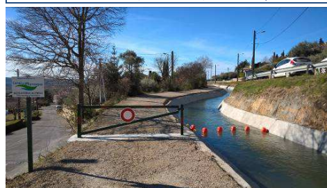
Portion du canal maître cuvelé à Villeneuve (entreprise MINETTO)